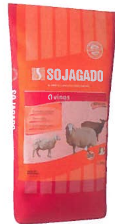
Figura 3 - Saco de ovinos Sojagado

Neste seguimento, pode concluir-se que, dada a grande importância desta fase em todo o ciclo produtivo, a mesma, deverá ser bem enquadrada e articulada com todas as restantes fases, reforçando os cuidados quer em termos de nutrição (qualidade e quantidade dos alimentos), quer em termos de manejo. A Sorgal, através das marcas Sojagado e Pronutri, disponibiliza soluções de enquadramento técnico de produtos que podem ser personalizadas a cada caso, potenciando os seus resultados.